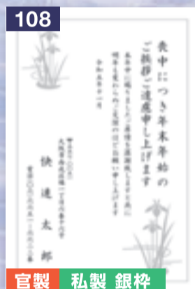
108 官製 私製 銀枠