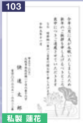
103 私製 蓮花