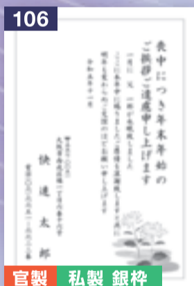
106 官製 私製 銀枠