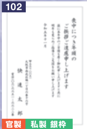
102 官製 私製 銀枠