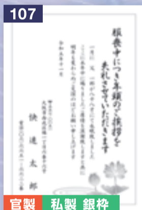
107 官製 私製 銀枠