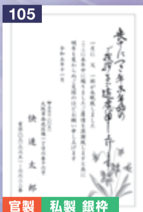
105 官製 私製 銀枠