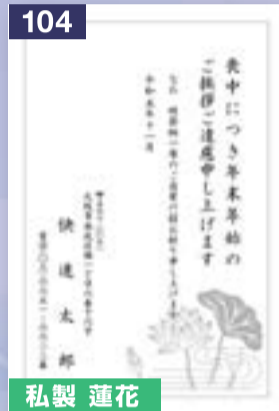
104 私製 蓮花